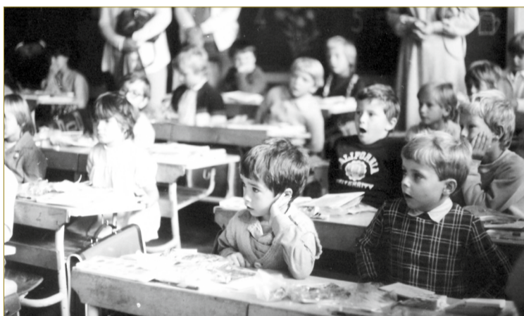
První školní den 1985 - 1986