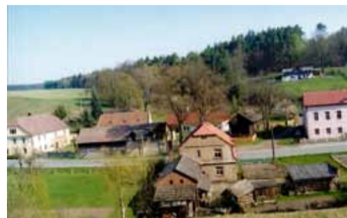
r. 2004 (č. p. 16). Obr. 2: Tatáž budova školy – růžová – vpravo po opravě fasády v r. 2004, v popředí rodný dům paní Bártové s hospodářským zázeminím (bývalá četnická stanice) z jižního pohledu.

... Autorka článku se omlouvá za chyby v textu v předchozí kapitole Jak se žilo v Dolní Krupé... část 1., vzniklé přestrukturováním textu: odst. 1., věta správně zní: Dolní Krupá už spadala do pohraničního regionu Deutschböhmen...; odst. 3., oprava gramatiky: Jak se dosídlovalo pohraničí, nastěhovali sem rodiny, co přišly o majetek. No a pracovaly tady, na státním statku.